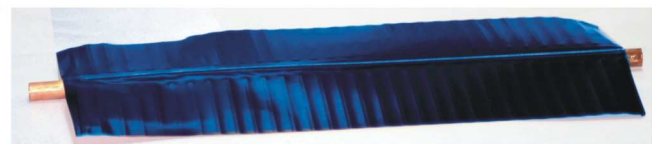
Selektif Kaplamalı Kanat